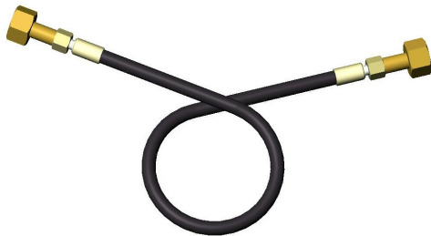
Kunststoffschlauch für Flaschenbatterie und Flaschenbündel